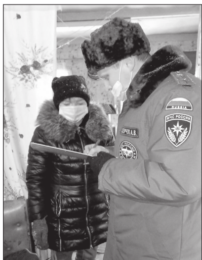
▲ Сотрудники МЧС проводят работу с населением

На момент прибытия первого пожарного подразделения, благодаря участию соседей, пожар был потушен. В результате возгорания повреждена кровать и 0,5 квадратного метра дома. В помещении был обнаружен хозяин квартиры, получивший ожег второй степени. Причиной пожара стало курение в кровати, при том,