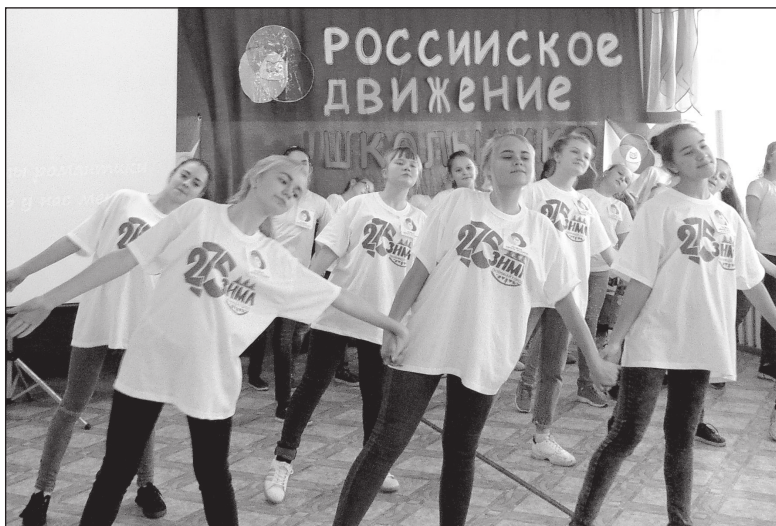
▲ Члены Российского движения школьников школы № 10

▲ Продолжение материалов о деятельности школы №10 читайте в следующем номере еженедельника