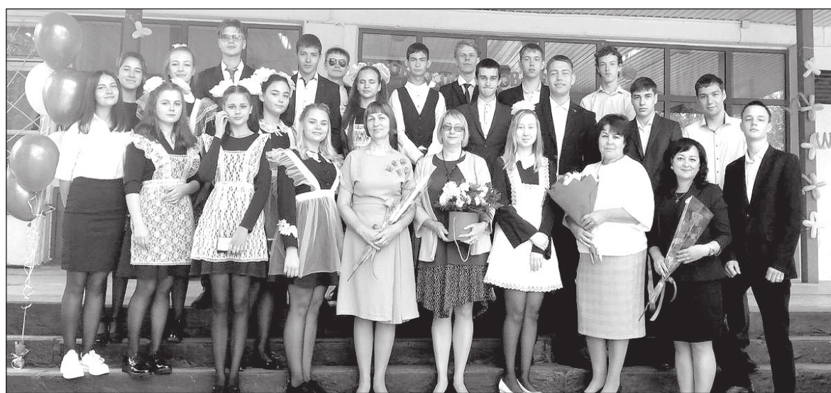
▲ 1 сентября 2020 г. Будущие выпускники

– Главное для меня то, что мы сохранили школу как действующее образовательное учреждение, сохранили наш коллектив, контингент учеников. В прошлом учебном году закончили реализацию программы развития «Развитие культурно-образовательного пространства школы