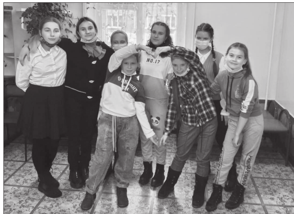
фото Даниила МИЛАУШКИНА ■