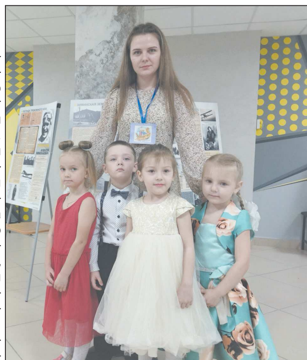
Фото Даниила МИЛАУШКИНА ■